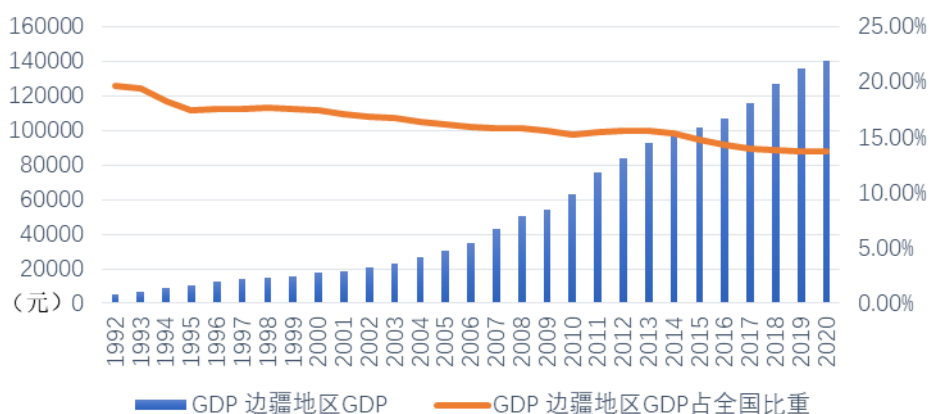
图2 1992—2021年边疆地区GDP与全国占比

第三，边疆地区经济发展不充分，是边疆地区参与共建“一带一路”高质量发展的内部挑战。中国边疆经济发展不充分，削弱了边疆地区参与周边国际合作的经济基础。中国经济发展的地区不均衡日益严重，相比于沿海和内地地区，边疆地区经济发展水平较低。边疆地区占全国经济份额不断下降，边疆地区GDP占全国占比从1992年的19.60%下降至2020年的13.77%（见图2）。边疆地区的人均GDP低于全国平均水平。边疆9省区居民人均可支配收入从2016年的28557元提高到2020年的36602元，但低于全国43834元（2020年）的平均水平。农村居民人均可支配收入从2016年的10506元提高至2020年的14767元，但低于2020年全国平均水平（17131元）。边疆地区居民人均收入呈现扩大趋势。 ①